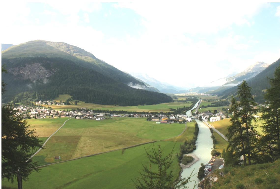
Vista su La Punt Chamues-ch, da Madulain

Il consiglio comunale, nell'ambito dell'imminente revisione della legge edilizia, stabilirà la strategia futura del comune in merito agli appartamenti di prima e di seconda residenza. Nel contesto della pubblica partecipazione, potranno le persone quindi anche prendere posizione in riferimento alle regolazioni proposte.