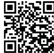
OR-Code Tweebie La Punt

Um der fortschreitenden Digitalisierung gerecht zu werden, ist mit der WebApp Tweebie ein digitaler Gäste-Informationsordner im Einsatz. Diese bildet alle relevanten Informationen für Gäste aktuell und übersichtlich an. Wie bei vielen digitalen Applikationen gibt es auch hier noch die eine oder andere Kinderkrankheit, welche durch die Nutzerrückmeldungen ausgemerzt werden müssen. Zusammen mit den Tourismus Managern der einzelnen Gemeinde hat die Engadin St. Moritz Tourismus AG (ESTM AG) beschlossen weiterhin nicht auf analoge Informationsbroschüren zu verzichten. Aus diesem Grund erscheinen die Engadin Guides saisonal in subregionalen Ausgaben (Seenregion, Herzregion, Pontresina & La Plaiv). Dies, da viele Feriengäste die analoge Information immer noch der digitalen Information vorziehen. In den Guides finden sich spannende Facts & Figures zu den Subregionen, sowie Porträts der einzelnen Gemeinden. Gefolgt von inspirierenden Tipps zu Ausflügen im Engadin, allgemeinen Informationen und einem Gastro Guide. Durch diese beiden Produkte ist auch weiterhin eine zeitgemässe Information für die Gästeinformation vor Ort gewährleistet.